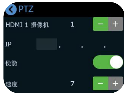
2.打开 PTZ 使能开关，设置摄像机数量并输入相应的 IP 地址(mini-pro 与摄像头需处于同一网段)