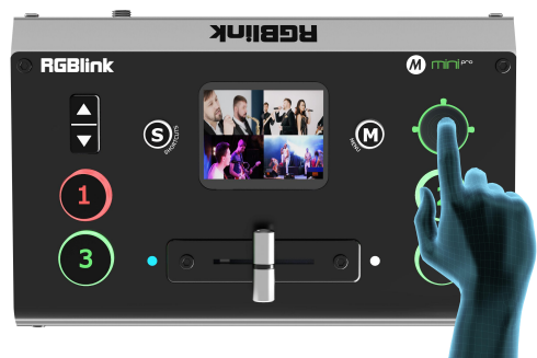
4.通过 摇杆 可以调整 PTZ 的转动调整角度，通过 上下键 可以调整 PTZ 的焦距