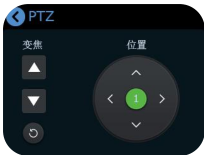
3.您可以调整摄像头的角度和位置