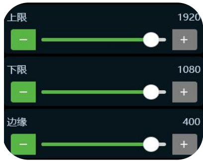
3.调整图像的上限，下限及边缘