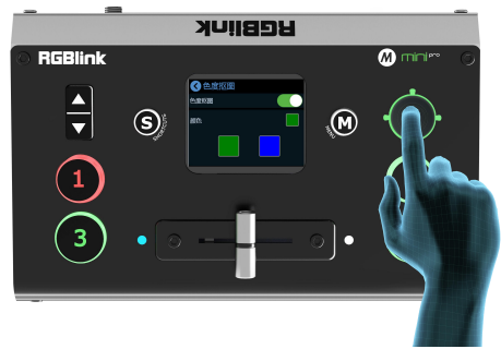
4.轻按 信号键 可以切换不同的信号，轻按 摇杆 可以切换主/子画面，并调整画面位置