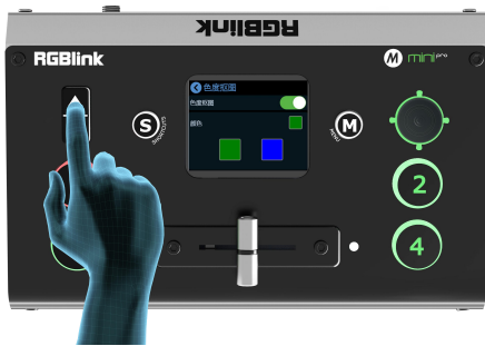
5.通过 上下键 调整画面的大小，所有重新调整的设置将实时保存到当前场景