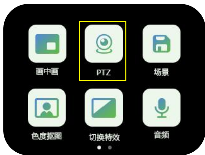
1.轻触【PTZ】进入设置菜单