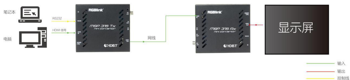
图为 MSP 315 的系统连接简图

MSP 315 延长器显示了视诚科技 HDBaseT 技术应用的特点, 其采用的无压缩数字传输法保证了信号传输的完整性。采用标准 CAT-5e 类线缆使 HDMI 信号扩展更易于安装在室内或者透过墙体安装。此外, 支持双向 IR 控制, 简易方便。还支持双向 12V POE 供电功能, 简化布线。