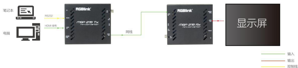
图为 MSP 215 的系统连接简图

MSP 215 延长器显示了视诚科技 HDBaseT 技术应用的特点, 其采用的无压缩数字传输法保证了信号传输的完整性。采用标准 CAT-5e 类线缆使 HDMI 信号扩展更易于安装在室内或者透过墙体安装。此外, 支持双向 IR 控制, 简易方便。还支持双向 12V POE 供电功能, 简化布线。